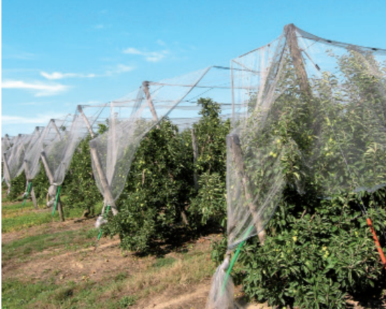
Verger de Provence

J e suis originaire de la région PACA et, après mes études, je souhaitais rester dans le Sud-Est. Après un premier poste chez Isagri à Avignon dans les logiciels agricoles, j'ai rejoint pendant six ans Pellenc dans le Lubéron comme ingénieur R&D, puis chef de projet Viticulture de précision, projet qui alliait GPS, capteurs embarqués, logiciel de cartographie de données, interprétation des résultats avec les viticulteurs, travail en lien avec la recherche... Passionnant !